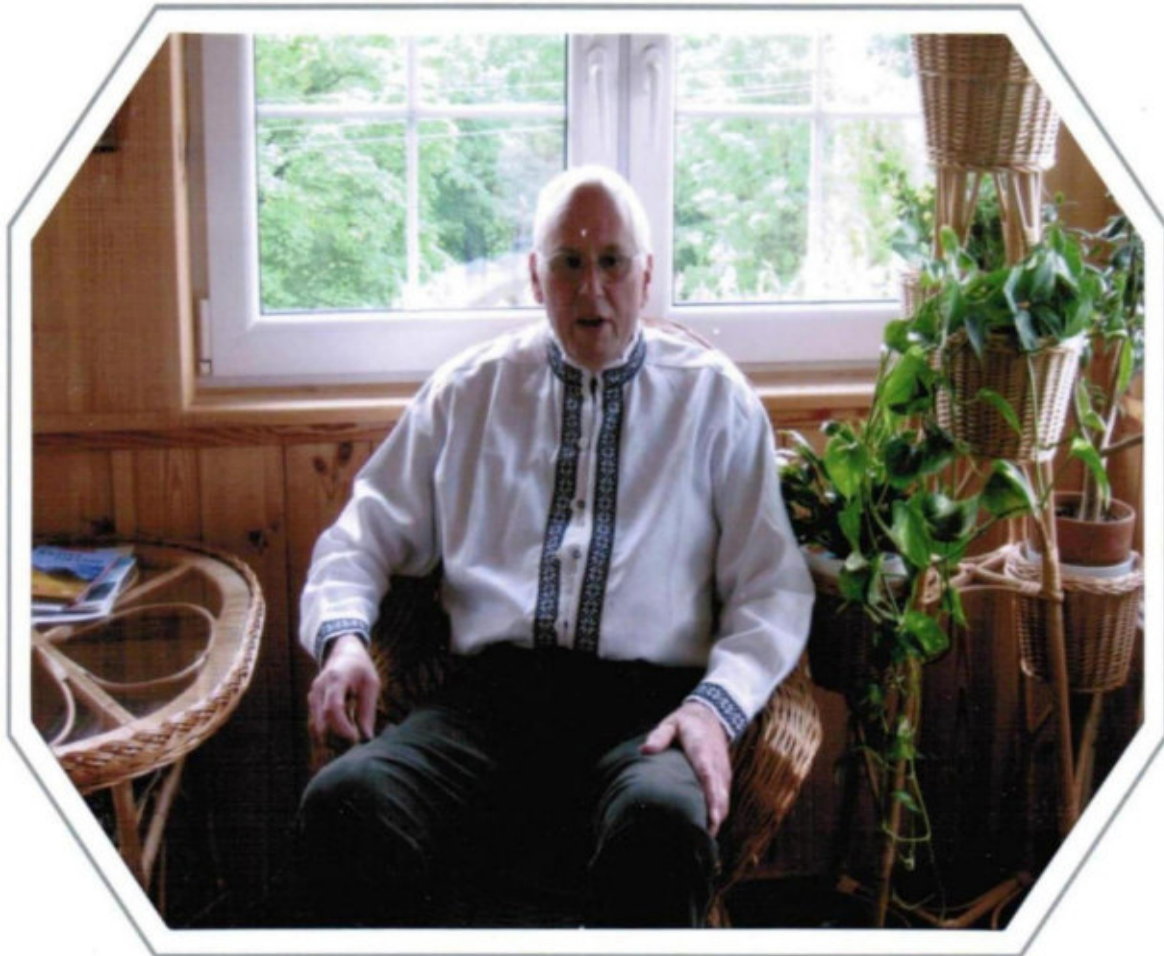
Ursprünglich das Haus von Alfred W i l m , jetzt Hanna und Kasimir in Saalberg 6/13