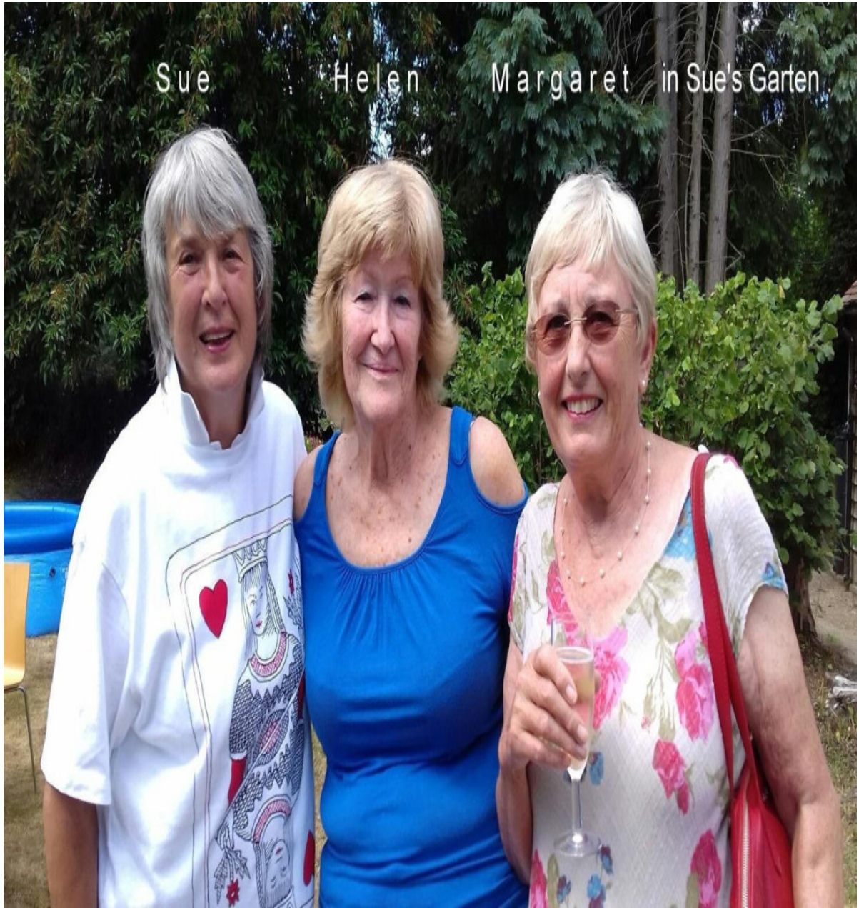
BADMINTON-FREUNDINNEN aus High Wycombe .