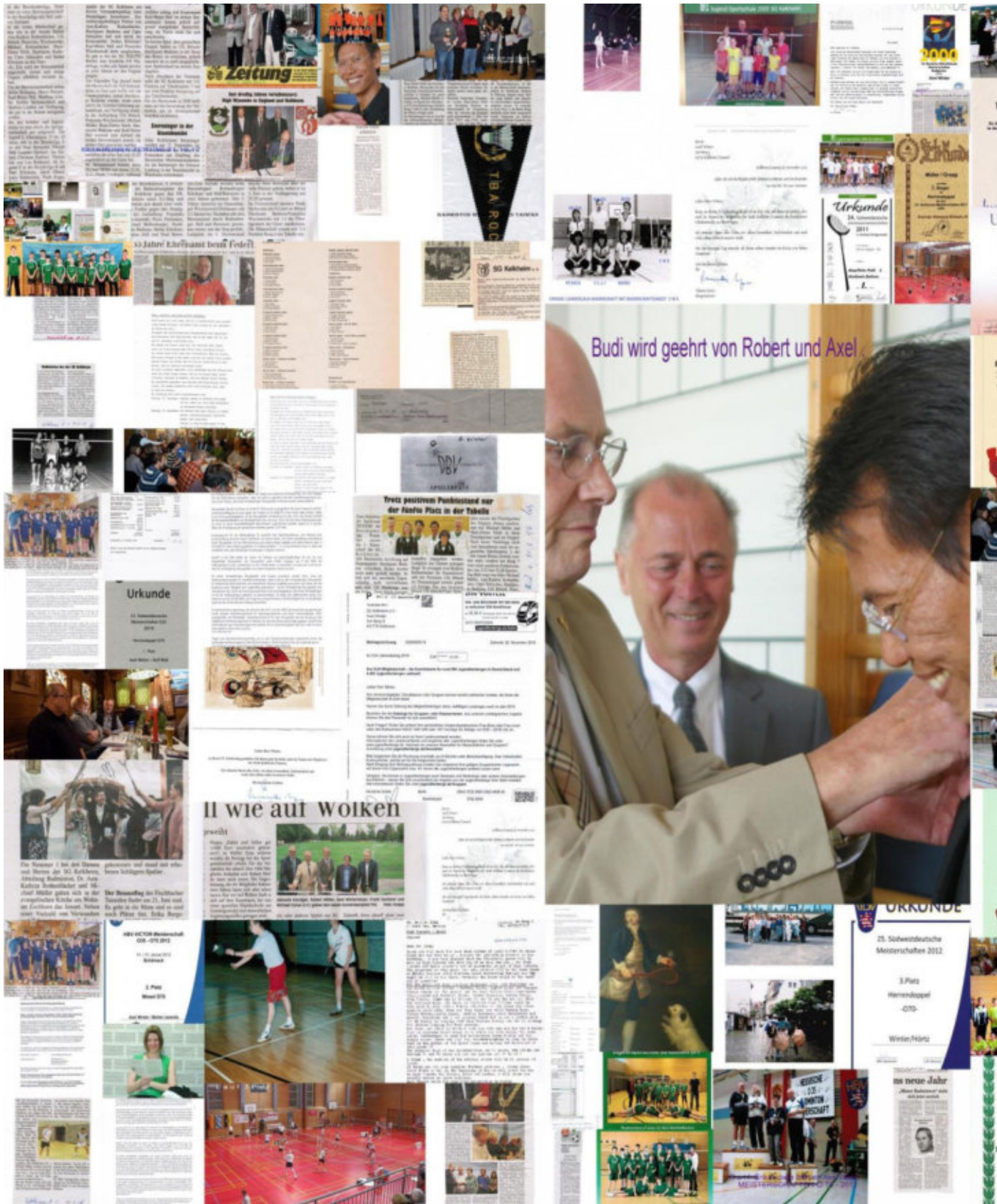
-BADMINTON - COLLAGE -65-Jahre !